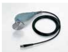
Pièce à main

Les accessoires et la mallette de transport sont inclus.